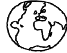
TABLE RONDE 3 : 2 ZOOMS