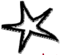
TABLE RONDE 1 : « Se lancer et formaliser une politique d'achats responsables dans une collectivité »