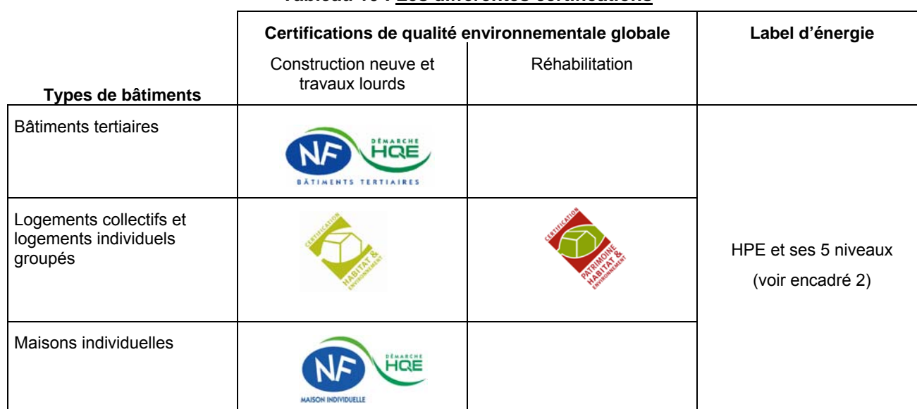
Tableau 10 : Les différentes certifications

Les organismes mandatés pour assurer actuellement la certification sont CERTIVÉA pour NF Bâtiment Tertiaire Démarche HQE, CÉQUAMI pour NF Maison Individuelle Démarche HQE, CERQUAL pour Habitat & Environnement et CERQUAL Patrimoine pour Patrimoine, Habitat & Environnement.